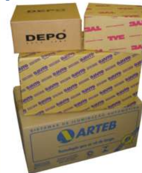
Części porównywalnej jakości