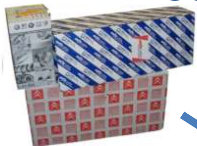
Części oryginalne z logo producenta samochodu