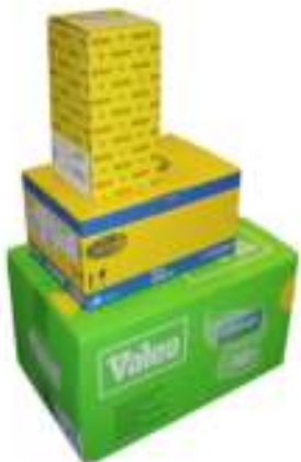
Części oryginalne z logo producenta części